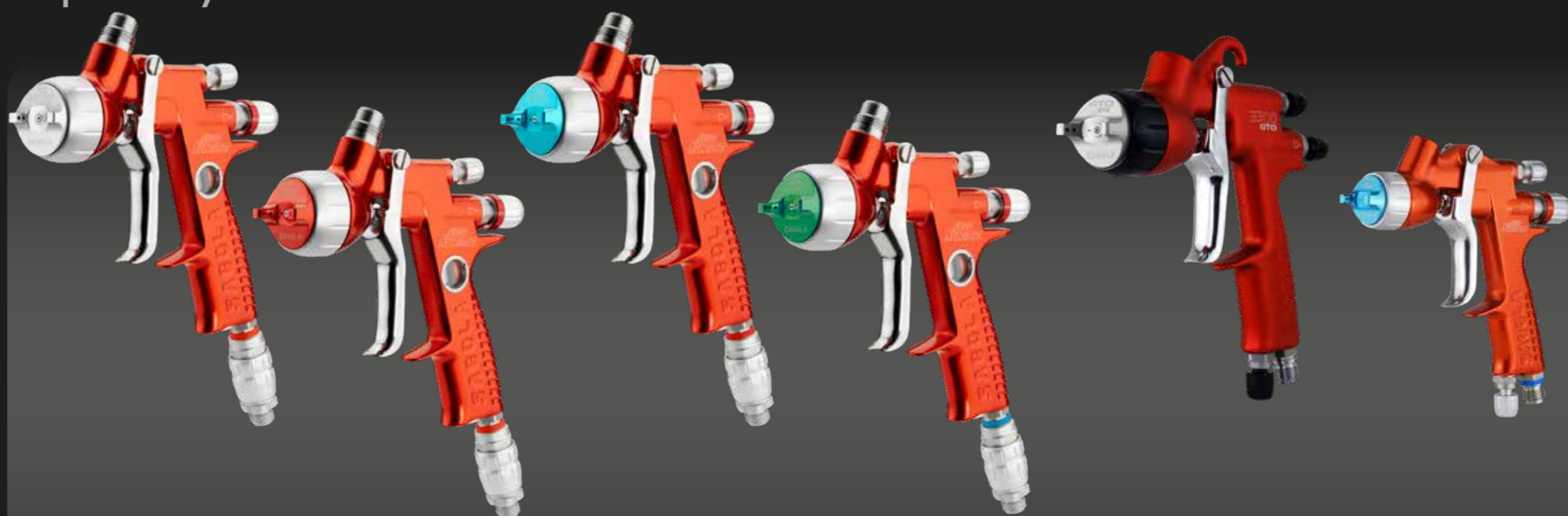
4600 Xtreme TITANIA PRO