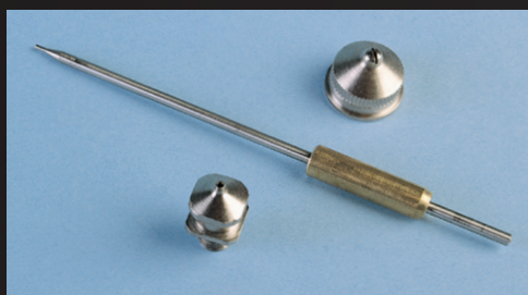
51410202 - Boquilla de aire 55010801 - Pico de fluido 56410227 - Aguja